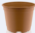
Circular terre cuite