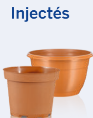
Circular terre cuite