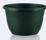
Circular vert pin